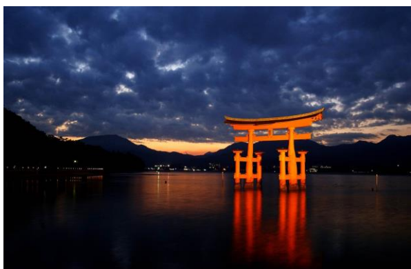
Torii flottant de l'île de Miyajima

Setouchi Tourism Authority a choisi de confier sa représentation à Interface Tourism, agence leader de communication, relations publiques, social media et marketing spécialisée dans le secteur du tourisme, pour son développement et sa promotion sur le marché français.